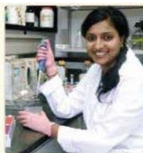
Incentivazione della ricerca