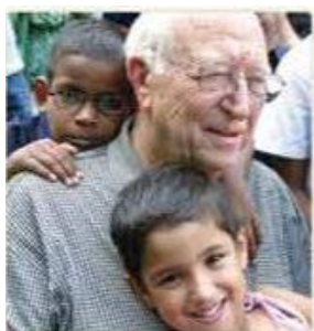
Aiuto ai deboli

sostenere con sussidi i Lions Clubs nella loro attività di servizio