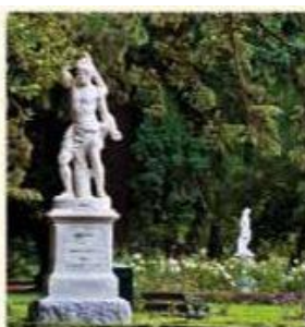
Tutela del patrimonio ambientale e culturale