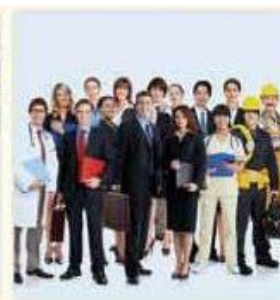
Inserimento dei giovani nel mondo del lavoro